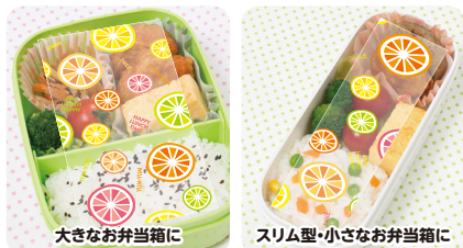
大きなお弁当箱に

シートには4分割のミシン目が入っており、手でかんたんにカットでき、様々なサイズのお弁当箱に対応します。